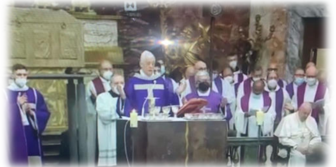
Santa Messa con il Papa a Roma

E ci farà bene oggi domandarci se la preghiera ci immerge in questa trasformazione; se getta una luce nuova sulle persone e trasfigura le situazioni. Perché se la preghiera è viva, “scardina dentro”, ravviva il fuoco della missione, riaccende la gioia, provoca continuamente a lasciarsi inquietare dal grido sofferente del mondo. Chiediamoci: come stiamo portando nella preghiera la guerra in corso? E pensiamo alla preghiera di San Filippo Neri, che gli dilatava il cuore e gli faceva aprire le porte ai ragazzi di strada. O a Sant'Isidoro, che pregava nei campi e portava il lavoro agricolo nella preghiera.”