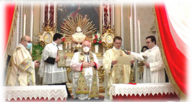
Santa Messa ai Filippini a Verona