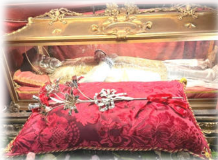
Corpo di San Filippo Neri a Roma